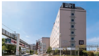
ビジネス・レジャーの 拠点

大船駅には6路線が乗り入れており、古都鎌倉や湘南江の島などの観光スポットへもアクセス良好です。ビジネス・レジャー拠点として大変便利にご利用いただけます。