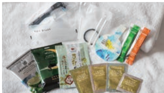
自由に選べる アメニティ

大船駅には6路線が乗り入れており、古都鎌倉や湘南江の島などの観光スポットへもアクセス良好です。ビジネス・レジャー拠点として大変便利にご利用いただけます。