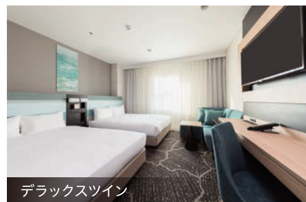
デラックスツイン