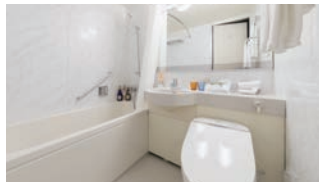
足を伸ばせる バスタブ

フロントロビーでお好きなアメニティをお持ちいただけるサービス「アメニティステーション」を設置。スキンケア用品、豊富な入浴剤、カミソリ、ヘアーブラシなどをご用意しています。