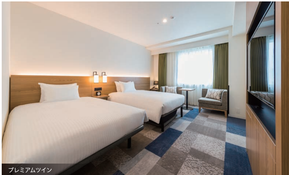
プレミアムツイン