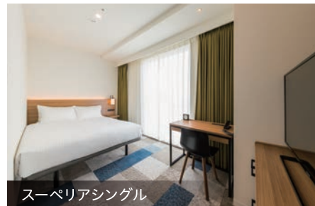
スーペリアシングル