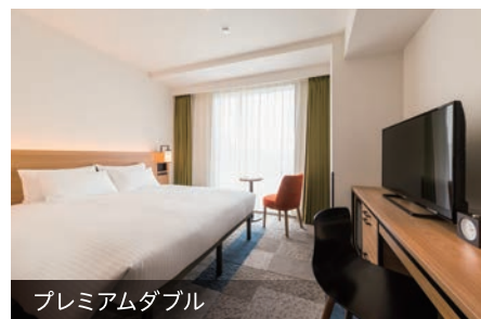
プレミアムダブル