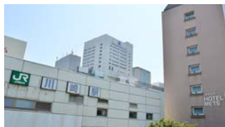
ビジネス・レジャーの 拠点