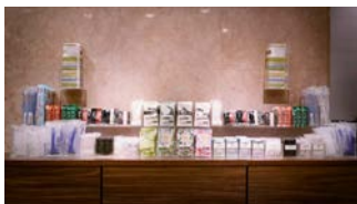
自由に選べる アメニティ