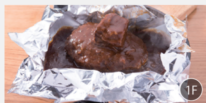
朝食会場「つばめグリル」 朝食時間 7:00~10:00

つばめ風ハンバーグステーキ・和風ハンバーグステーキ・サーモンのムニエル・ロールキャベツの日替わりメニューです。パンとライスをお選びいただけます。