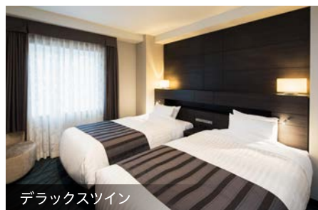
デラックスツイン