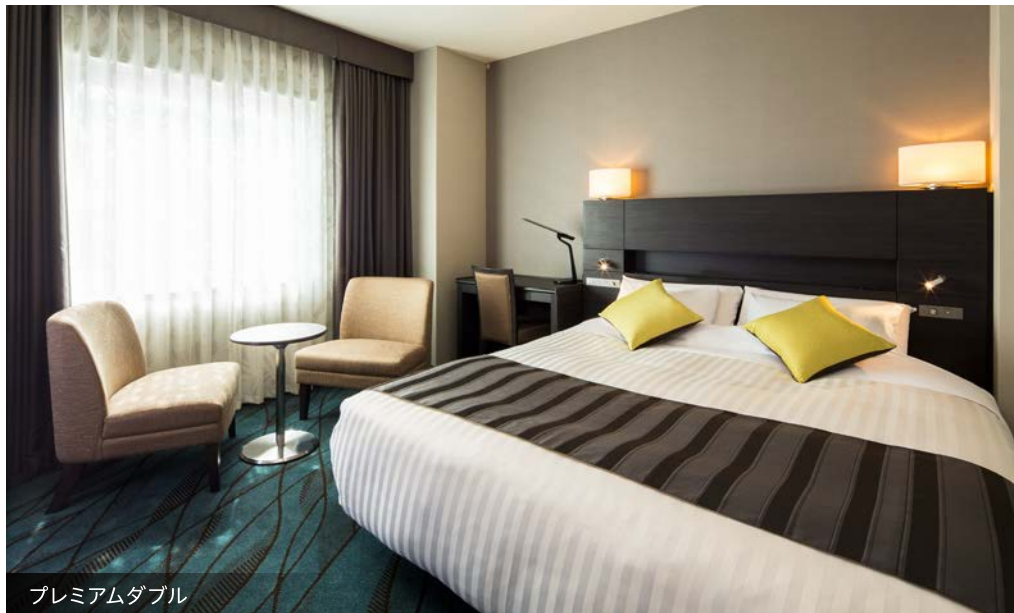
プレミアムダブル

眠りにこだわり、いつもと違う目覚めを体感できる空間 良質な眠りへといざなうベッド、機能的な家具で快適な滞在を提供します