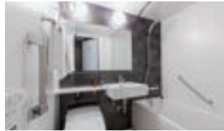
足を伸ばせる バスタブ

フロントロビーでお好きなアメニティをお持ちいただけるサービス「アメニティステーション」を設置。スキンケア用品、豊富な入浴剤、カミソリ、ヘアブラシなどをご用意しています。