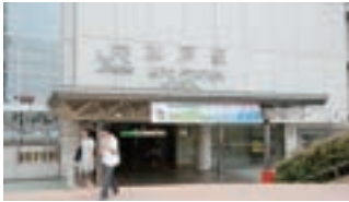
ビジネス・レジャーの 拠点

水戸駅には4路線が乗り入れており、駅周辺の偕楽園や弘道館だけでなく国営ひたち海浜公園や袋田の滝等の観光スポットへもアクセス良好。茨城県のビジネス・レジャー拠点として大変便利な立地です。