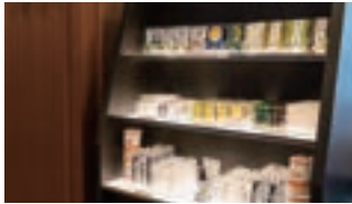
自由に選べる アメニティ

水戸駅には4路線が乗り入れており、駅周辺の偕楽園や弘道館だけでなく国営ひたち海浜公園や袋田の滝等の観光スポットへもアクセス良好。茨城県のビジネス・レジャー拠点として大変便利な立地です。