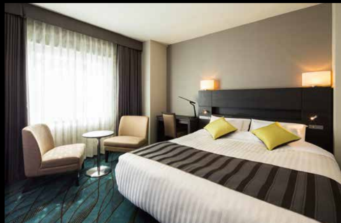
プレミアムダブル

緑あふれる自然と日本有数の産業が集積した川崎は 主要拠点へのアクセスに最適なエリア 「眠り」にこだわった温かみのある空間はきっと 日常の疲れを癒してくれます