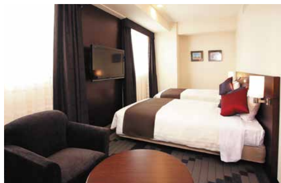
ユニバーサルツイン